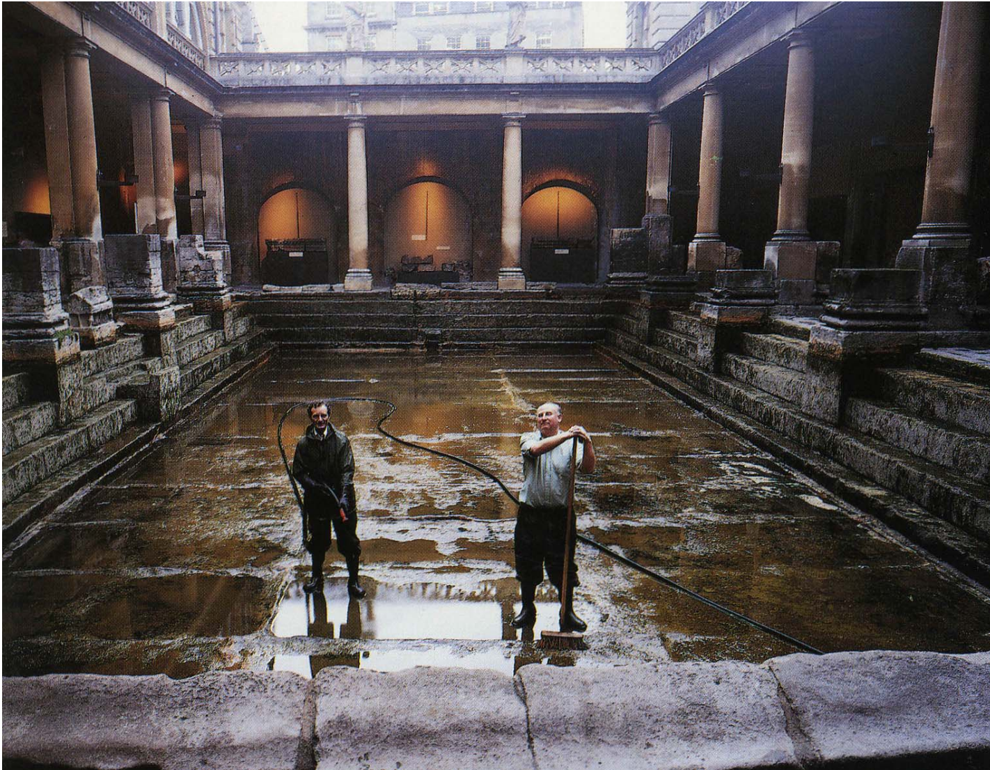
Bath / Aquae Sulis (England). King's Bath. Ein bis in s19. Jh. benutztes römisches Badebecken (hier in entleertem Zustand).