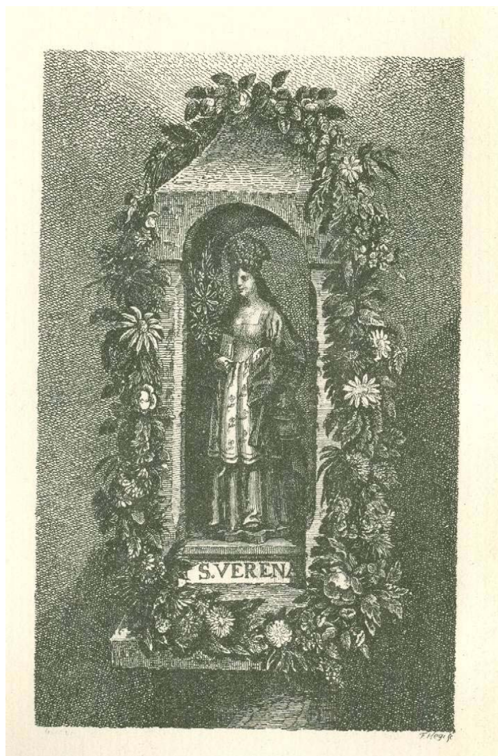
Radierung des einst beim St. Verenabad aufgestellten Bildstocks mit einer Statuette der Heiligen Verena von F. Hegi aus David Hess' Badenfahrt (1818).

Wahrscheinlich führt der Verenakult die wesentlich ältere religiöse Traditionen antiker oder gar vorrömischer Quellgötter und Fruchtbarkeitsgöttinnen – u.a. auch der in Baden verehrten Isis - fort.