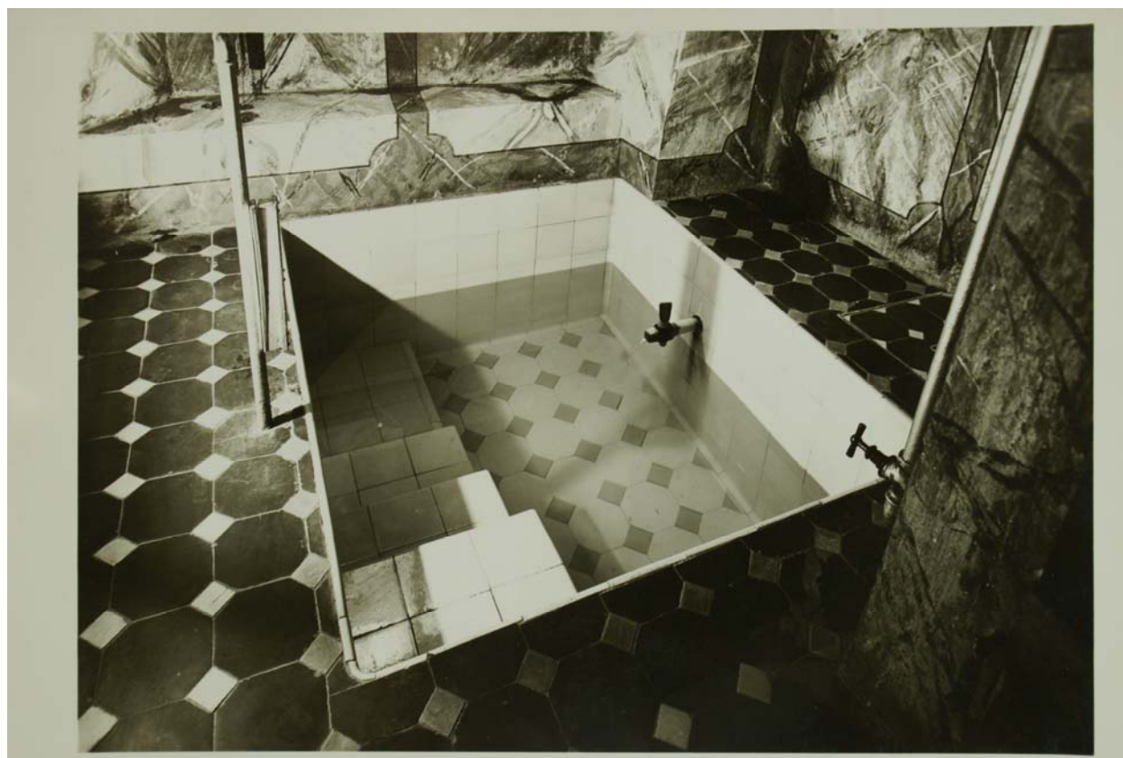
Einzelpiszine im Hotel „Bären“ zu Beginn des 20. Jh. Die Zufuhr von frischem Quellwasser erfolgte über den rechts erkennbaren, hölzernen Hahn.

Die anderen Gasthäuser folgen den neuen Moden und Erkenntnissen ebenfalls und richteten sich – in ihren alten Mauern - den n Bedürfnissen entsprechend ein. Auch der damals bereits etwas veraltete „Hinterhof“ versuchte ein letztes Mal, sich den modernen Bedürfnissen anzupassen.