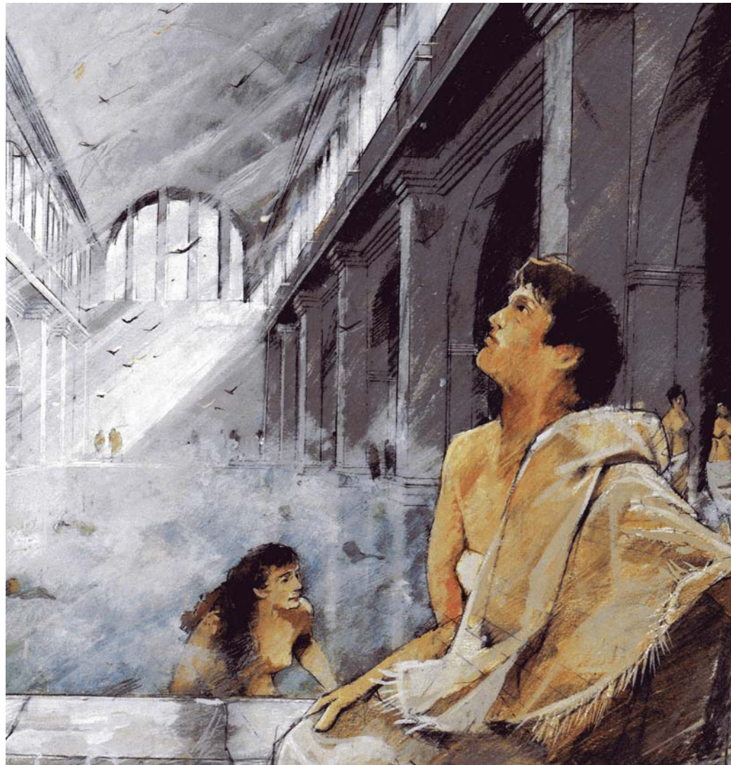
Szene in den römischen Thermen von Bath / Aquae Sulis (England). Rekonstruktionszeichnung (aus B. Cunliffe: The Roman Baths. A View over 2000years. Bath archaeological Trust, Bath)

Die römische Badekultur blieb während Jahrhunderten das Mass aller Dinge und erlebt heute mit dem vielgestaltigen Wellnessboom wieder eine Renaissance.