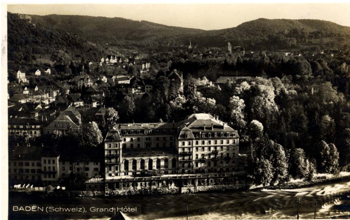
Postkarte von 1902. Das Grand Hotel steht an Stelle des einstigen Hinterhofs.

Von den einstigen Bauten des Hinterhofs ist heute nur noch das aus dem 18. Jh. stammende sog. Dorerhaus erhalten. Das östlich daran angebaute „Römerbad“ wurde in den 1870er-Jahren als Nebengebäude des Grand Hotels errichtet, ist also wesentlich jünger und hat – auf den ersten Blick jedenfalls – auch gar nichts mit den Römern zu tun.