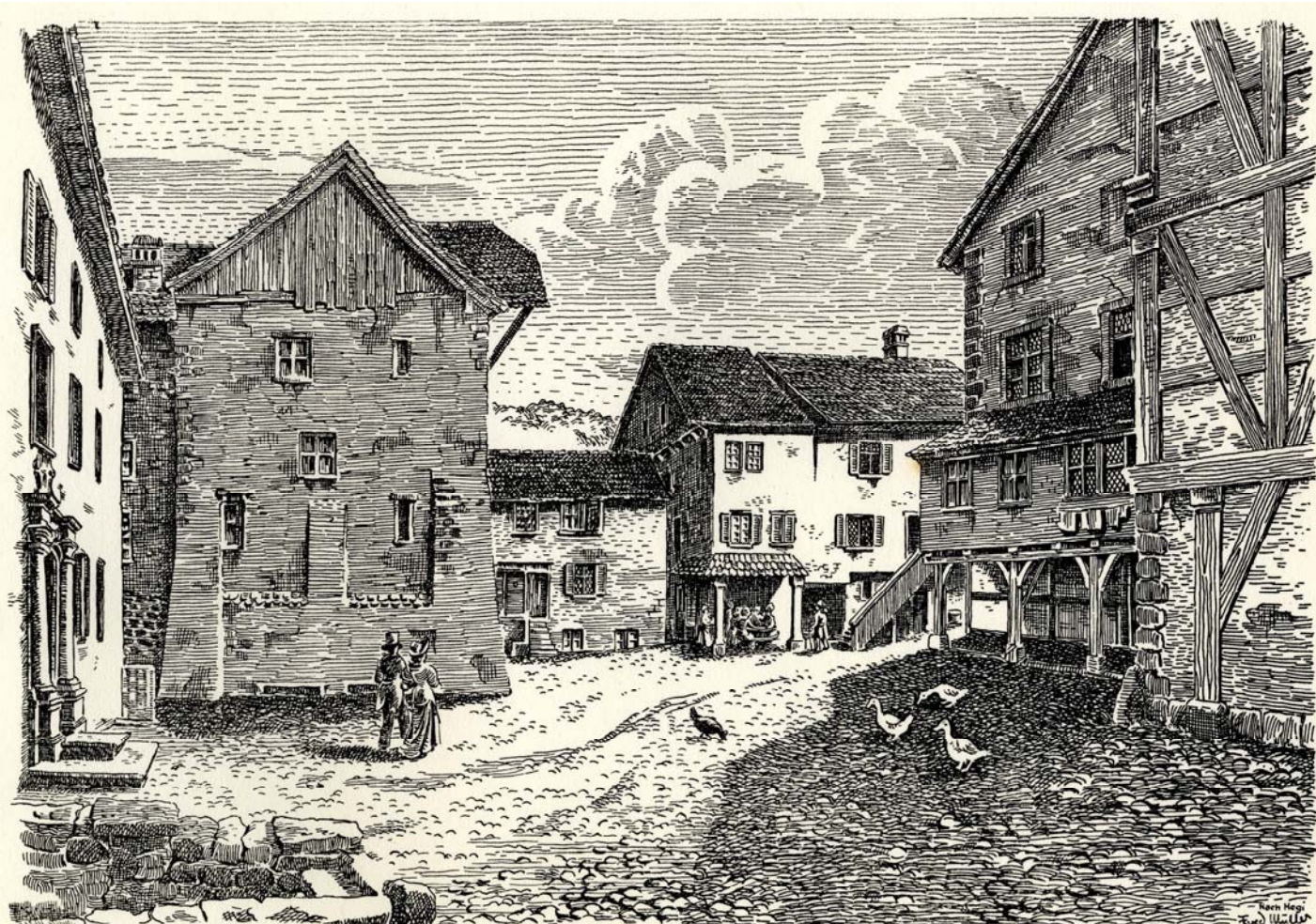
Der Hinterhof im frühen 19. Jh. Rechts das Fälcklein, links das Dorerhaus und das Habsburgerhaus (Abb. aus Münzel 1946).

Der Hinterhof auf dem Stich von M. Merian 1642 (Abb. aus Münzel 1946).