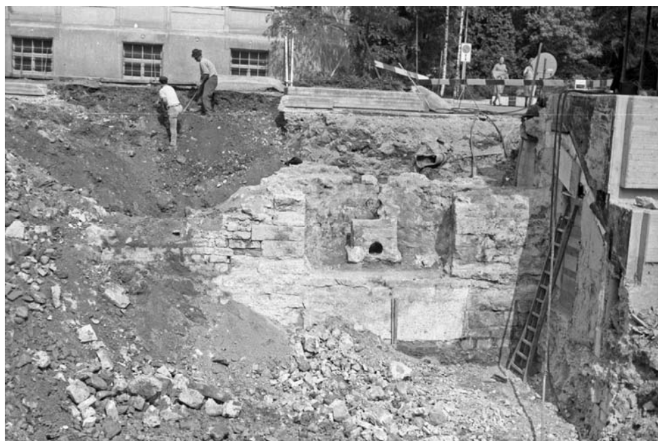
Freilegung der heute im Medizinischen Zentrum erhaltenen Apsis eines römischen Bades anlässlich der Bauarbeiten für den neuen Stadthof 1967-1969.

Archäologisch ist das Badener Bäderquartier erst ansatzweise erforscht. Während Jahrhunderten wurden bei Bauarbeiten, aber auch beim Reinigen der Quellen immer wieder Funde namentlich aus der römischen Zeit gemacht. Anlässlich des Baus des Thermalbades 1963 und der Neubauten von Stadthof und Trinkhalle 1967-1969 wurden die damals zum Vorschein gekommenen Funde aus der Vergangenheit den Umständen entsprechend leider eher schlecht als recht dokumentiert. 1968 wurden die Fundamentreste der ehemaligen Dreikönigskapelle ausgegraben, 1980 erfolgte eine kleine Grabung im Bereich des Aussenbades des Thermalbades, welche neben Ruinen mittelalterlicher Bauten auch immer römische Befunde erbrachten.