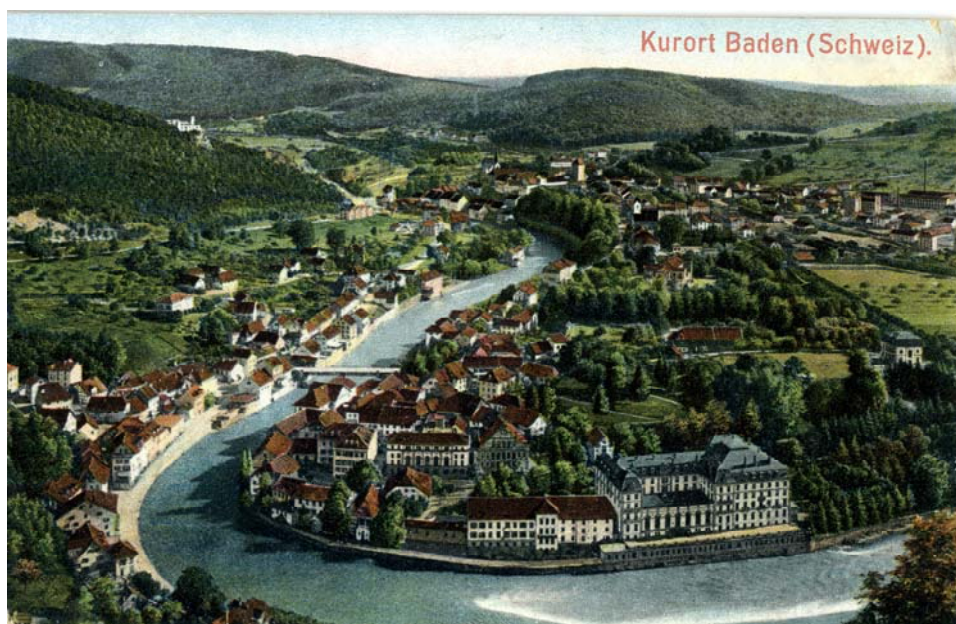
Ein Bild aus grossen Tagen. Postkarte aus dem Jahr 1902.

Wohl schon lange vor der Römerzeit wurde in Baden das hier aus mehreren Quellen entspringende Thermalwasser zu Heilzwecken genutzt. Von der Antike bis zum Beginn des Alpentourismus im 19. Jh. waren die Bäder von Baden der bedeutendste „Tourismusmagnet“ der Schweiz. Im 20. Jh. erfolgte nach einer letzten Blütezeit ein langsamer Niedergang; doch der Geist des einst grossen Badekurorts lebt heute noch immer.